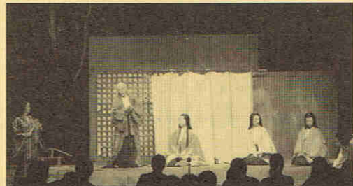
源氏来訪の報に、慌てて末摘花のもとへ馳せ戻る叔母や奥女中達。