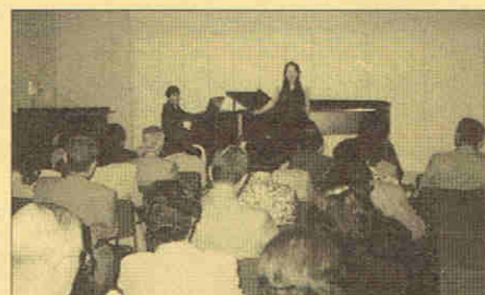
トモノ・ホールでの懇親パーティ・コンサート